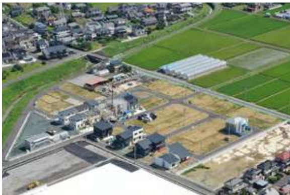
ブリックタウン下垂木(60区画) 掛川市下垂木