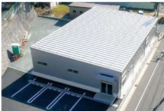
YESS建築(事務所) 浜松中区中沢町