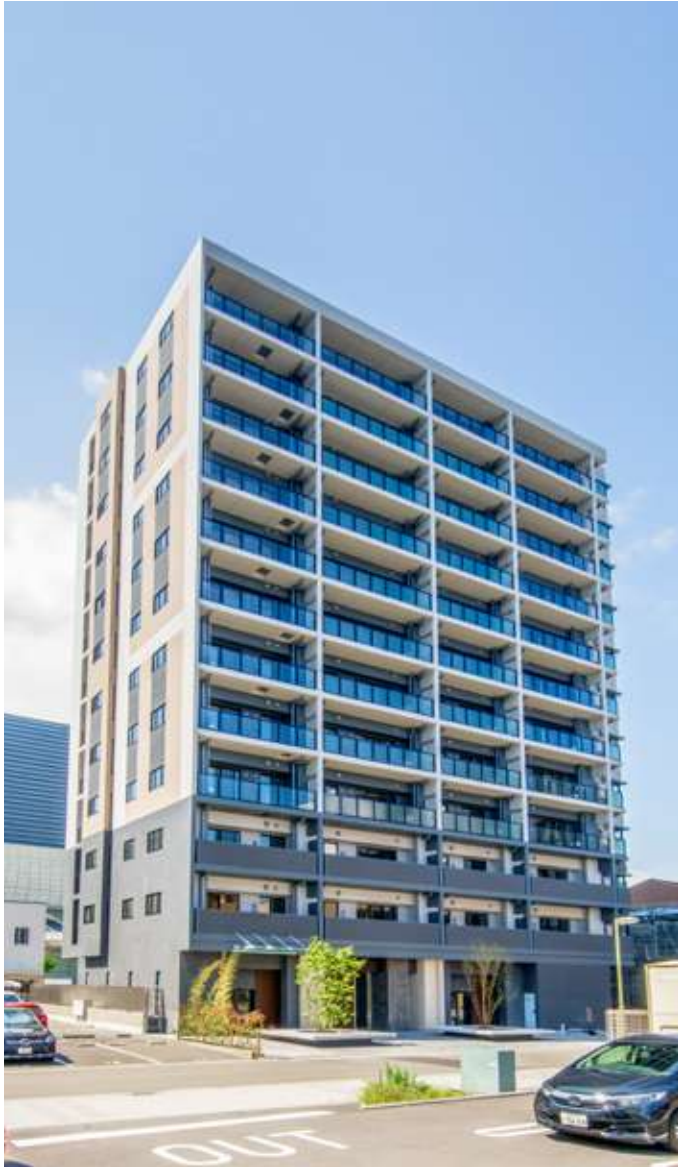
アルビオ・ガーデン東静岡