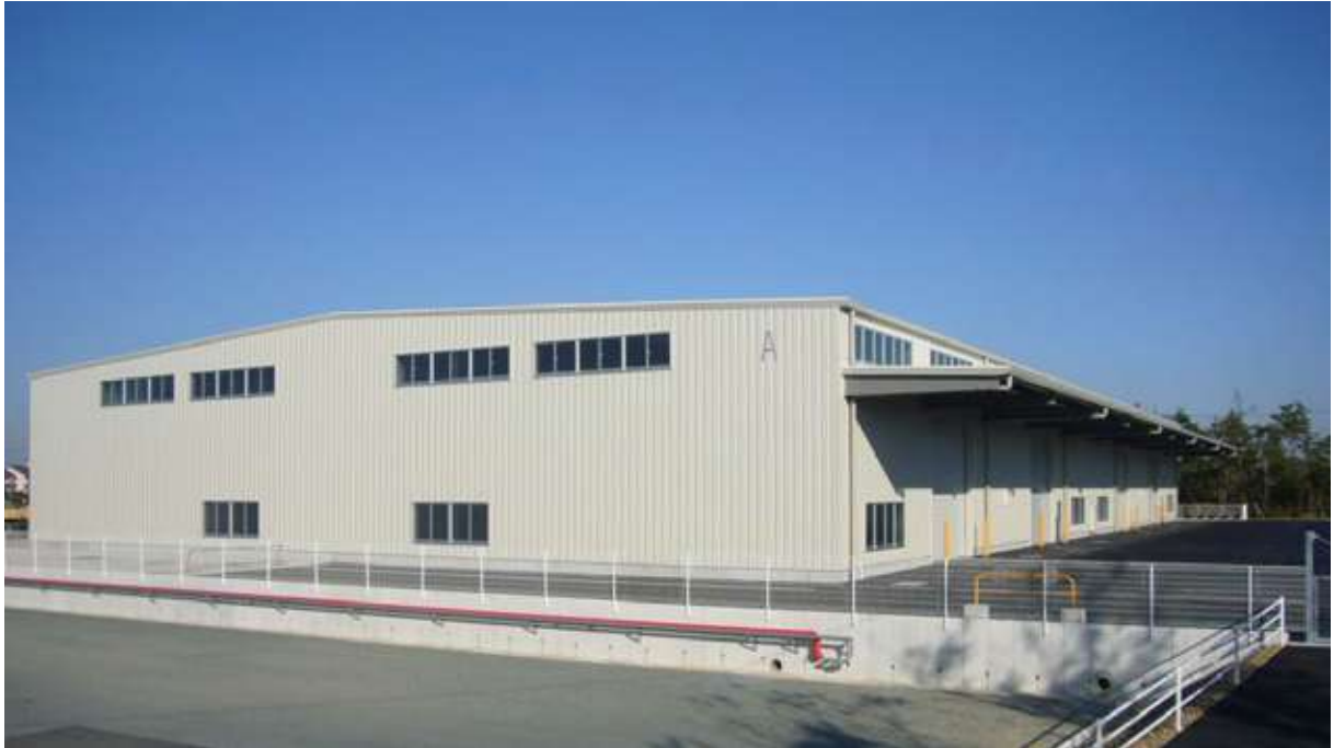
YESS建築(倉庫) 磐田市福田中島