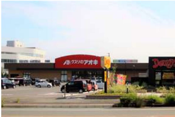
敷地面積 / 10,861㎡ 出店テナント: クスリのアオキ、デニーズ