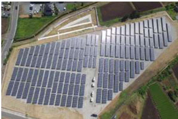
ビルド21磐田パワーステーションN/S:磐田市大久保 出力1,090kW(一般家庭272軒分)/発電パネル4,114枚(京セラ製)