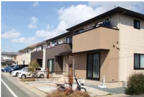
ブリックタウン小豆餅(10区画) 浜松市中区小豆餅