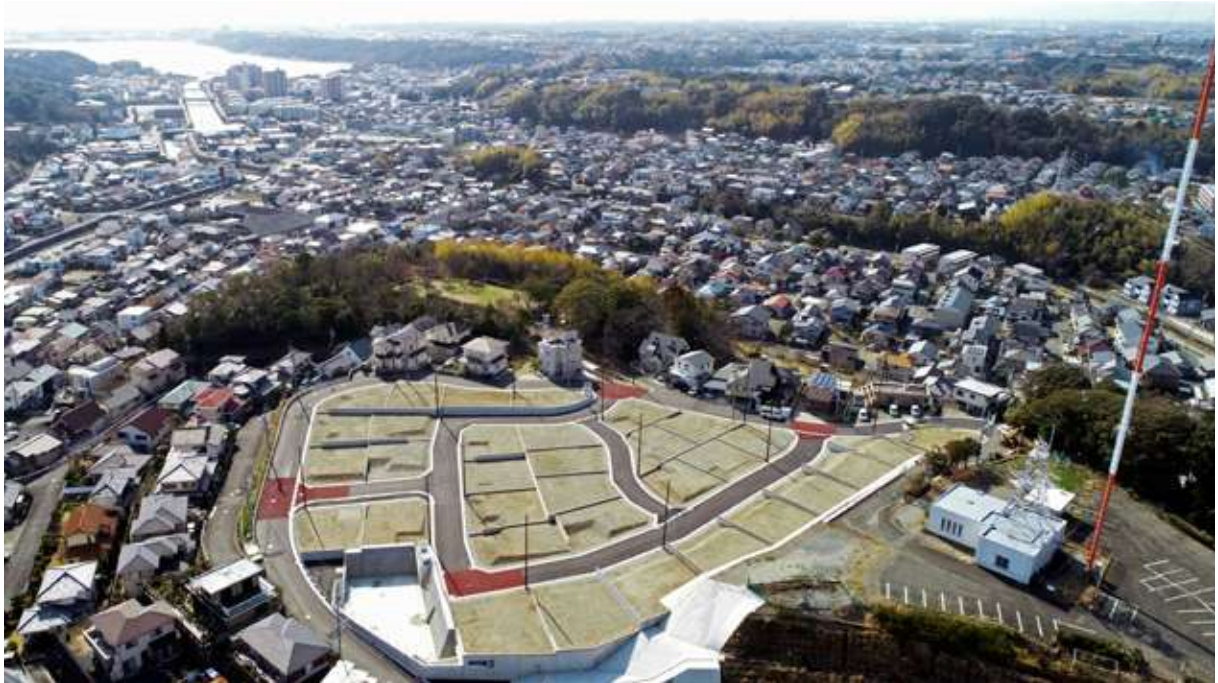
ブリックタウン富塚の杜(33区画) 浜松市中区富塚