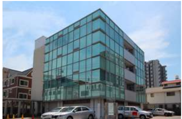
センチュリースペース沼津駅北口 (Office) 沼津市高島町