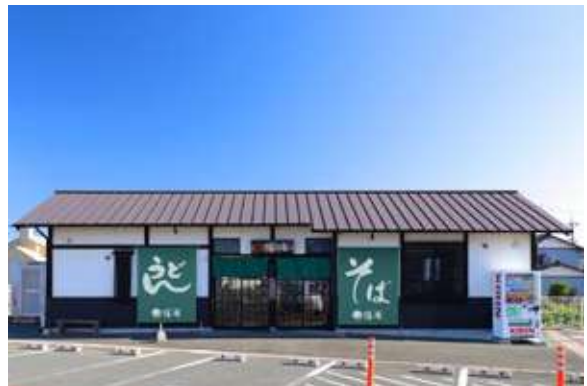
店舗(飲食店) 磐田市中泉