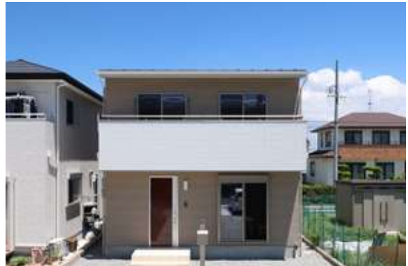
スマイル増楽8期3号棟 浜松市南区増楽町