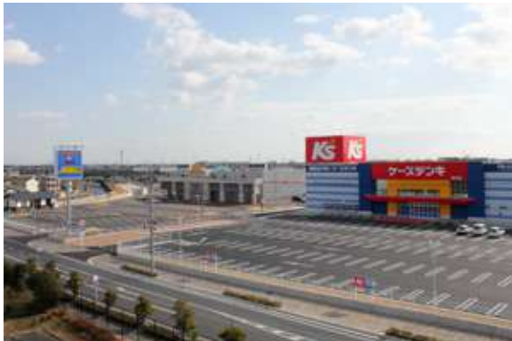
plaza21 中泉 (Commercial) 磐田市中泉