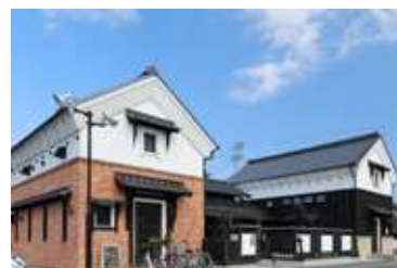
袋井店 住所:袋井市旭町1-18-15