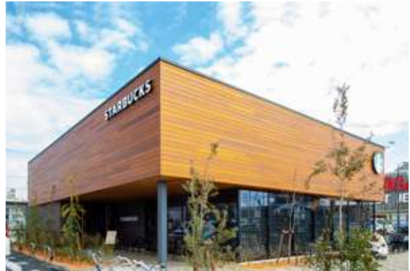
敷地面積 / 1,567㎡ 出店テナント: スターバックスコーヒー