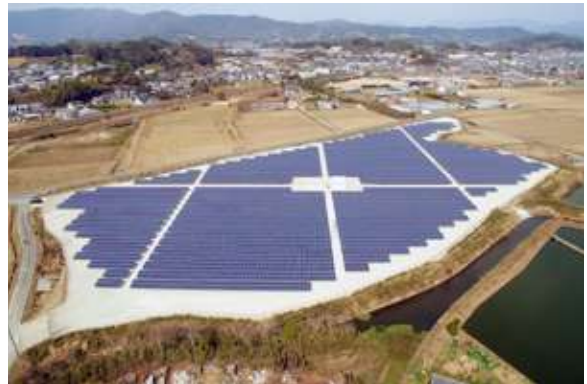
ビルド21メガソーラースクウェア:湖西市岡崎 出力2,212kW(一般家庭553軒分)/発電パネル8,848枚(シャープ製)