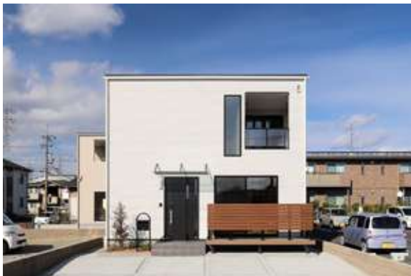
スマイル袋井旭町2号棟 袋井市旭町