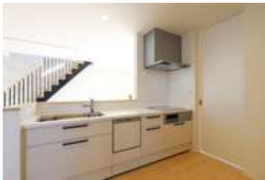
自分好みのキッチンづくりが可能です。