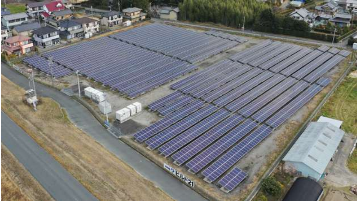
ビルド21メガソーラースクウェア:磐田市吉貫地 出力853kW(一般家庭212軒分)/発電パネル3,556枚(シャープ製)