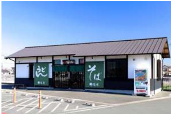
磐田中泉店 住所:磐田市中泉848-1

静岡・愛知を中心に約50店舗を展開している「そば処 鐘庵」。 名物《桜えびかき揚げ》は創業者:大鐘正敏考案の特別製法にて《踊り揚げ》とも言われています。 年間約160万個の桜えびかき揚げ《踊り揚げ》を提供する鐘庵は、名実ともに日本最大の桜えびかき揚げ専門の蕎麦チェーンです。