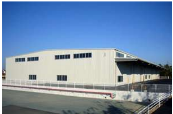
福田中島倉庫 (Industrial) 磐田市福田