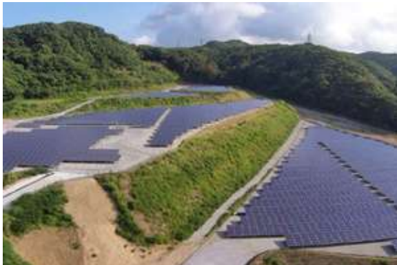
ビルド21掛川パワーステーション:掛川市大淵 出力1,739kW(一般家庭433軒分)/発電パネル6,540枚(京セラ製)