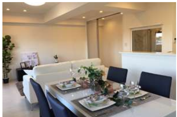
セレブコート蛸塚