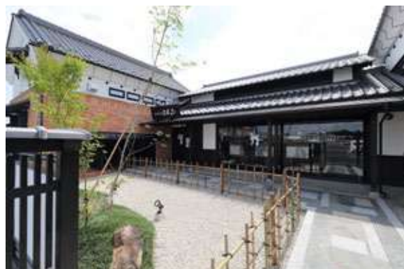
掛川店 住所:掛川市下垂木1875-10

「珈琲屋らんぷ」のこだわりは、珈琲豆のベテラン焙煎師である創業者によって生み出されました。 明治時代をモチーフとした蔵造りの建物には、少しでも多くの珈琲好きな方々に美味しい珈琲を味わっていただきたい、 という創業者の想いが隅々までつまっています。