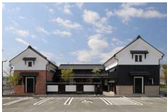
浜松高林店 住所:浜松市中区高林5丁目2-21