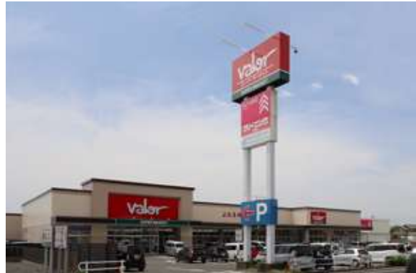
敷地面積 / 11,900㎡ 出店テナント: パロー