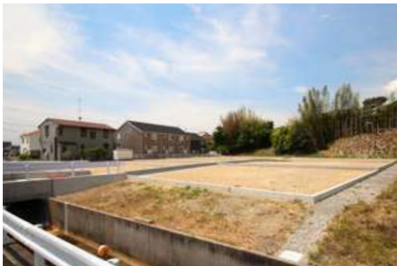
ブリックタウン細江町三和(8区画) 浜松市北区細江町三和