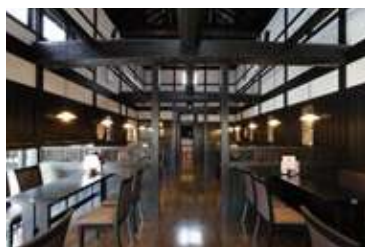
磐田店 住所:磐田市見付6038-5