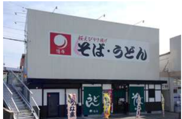
磐田岩井店 住所:磐田市岩井2332-4