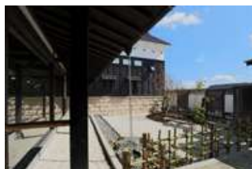
浜松原島店 住所:浜松市東区原島町576-1