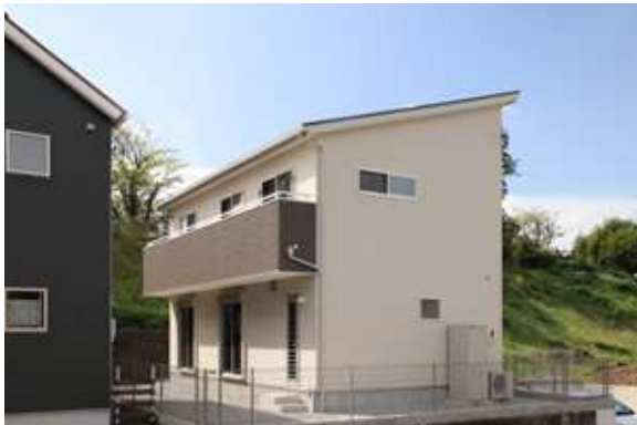
スマイル見付安久路 磐田市見付安久路

スマイルホームは、セミオーダーの規格型住宅だから低価格で、高いクオリティの家づくりが可能です。