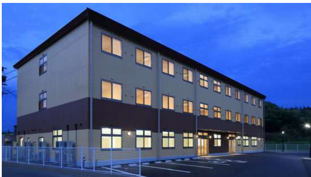
ふるさとホーム掛川 掛川市下垂木