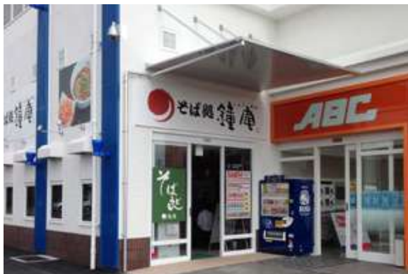
浜松森田町ABC店 住所:浜松市中区森田町字綱手西304-31