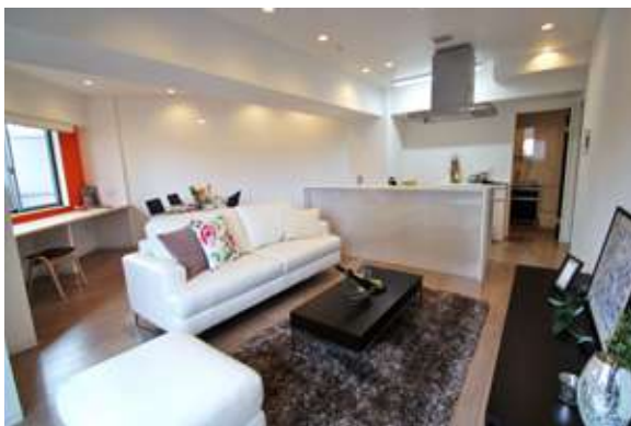
イーステージ浜松タワー