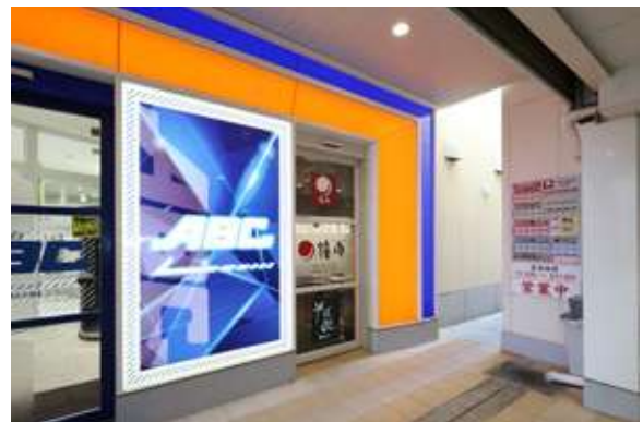
浜北ABC店 住所:浜松市浜北区横須賀1133-1