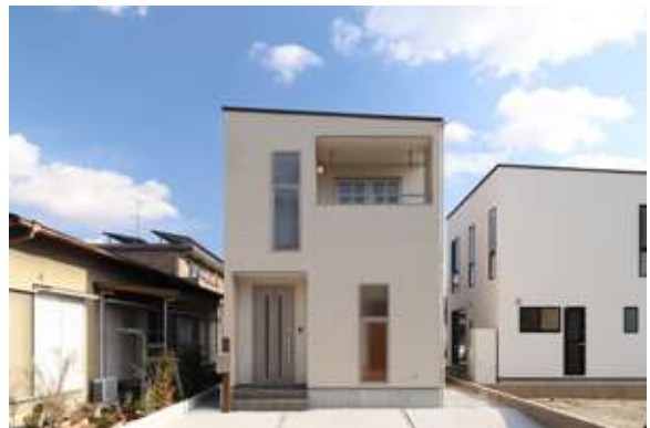
スマイル袋井旭町3号棟 袋井市旭町