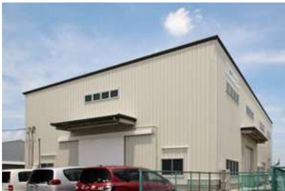
YESS建築(工場) 浜松市東区貴平町