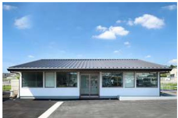
店舗(コインランドリー) 掛川市下垂木