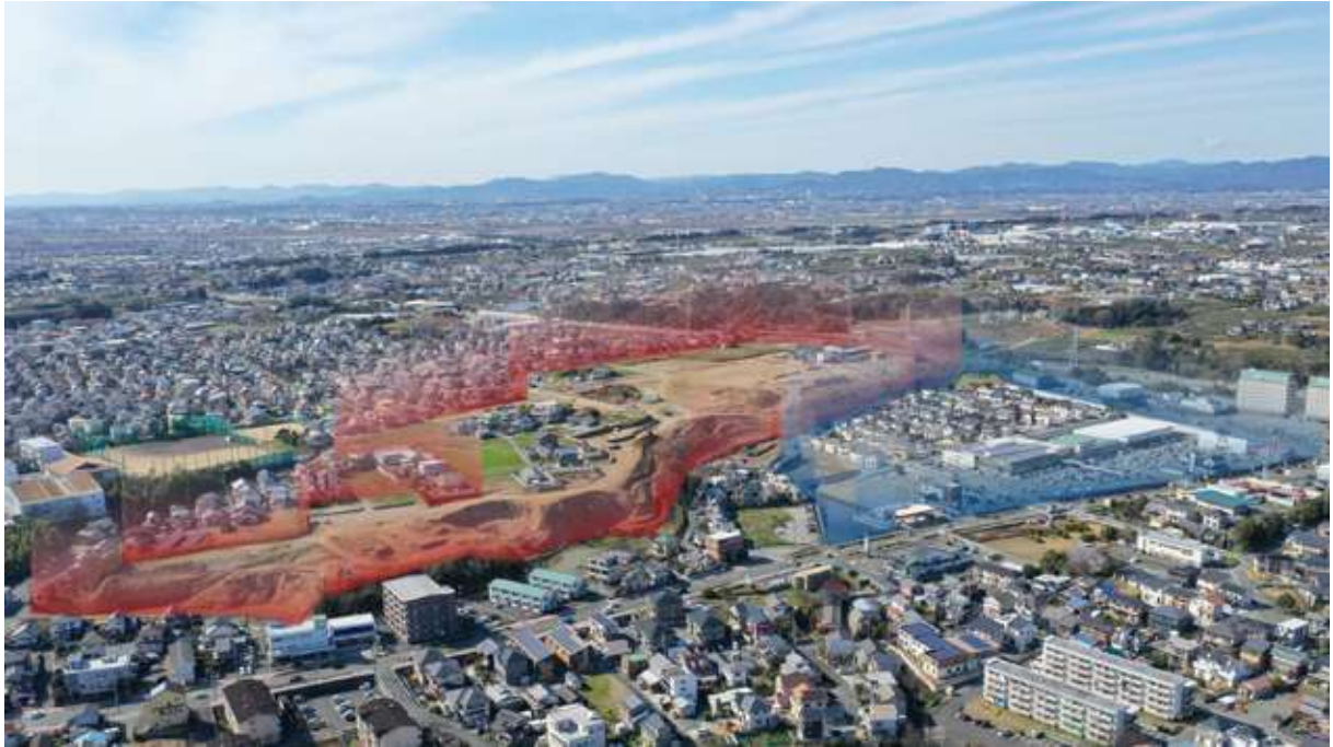
見付美登里土地区画整理事業(約380区画) 磐田市見付