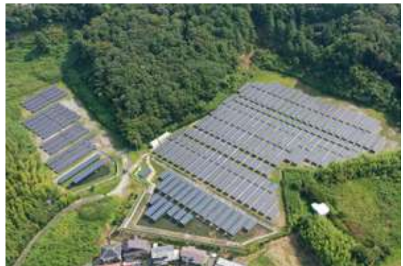
ビルド21パワーセンター:袋井市宇刈 出力1,326kW(一般家庭331軒分)/発電パネル5,040枚(シャープ製)