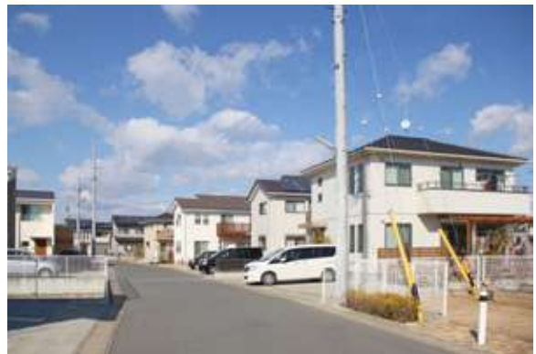
ブリックタウン豊田町(23区画) 磐田市下万能