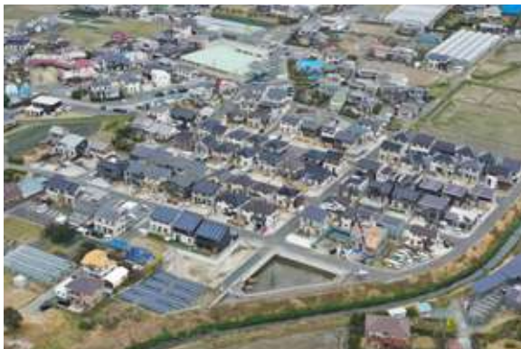
ブリックタウン中郡(75区画) 浜松東区中郡