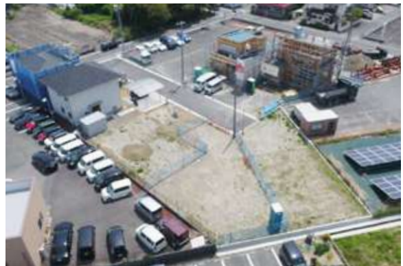
ブリックタウン豊田西之島(9区画) 磐田市豊田西之島