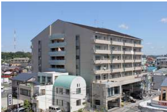
エンブレム元浜 (Residential) 浜松市中区元浜