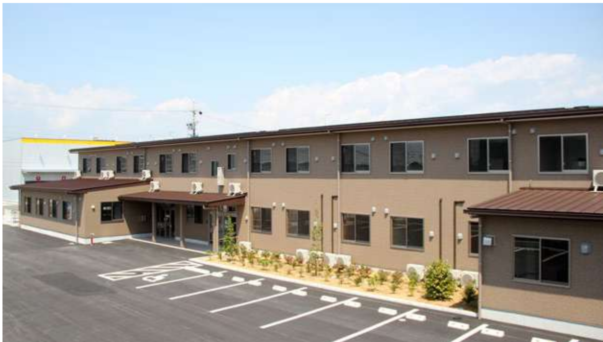
ふるさとホーム磐田 磐田市中泉