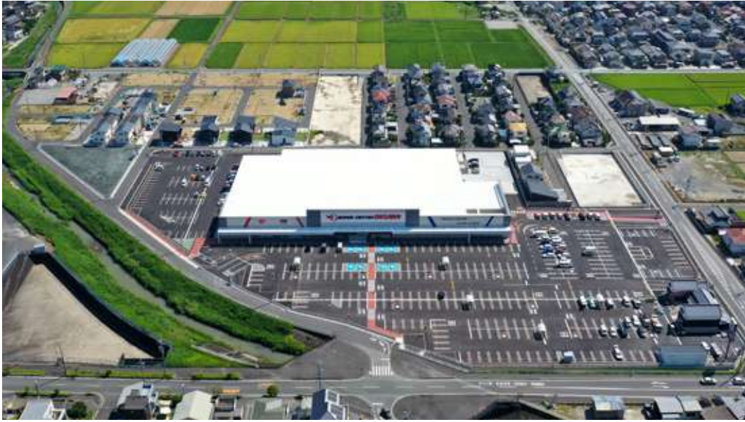
敷地面積 / 25,917㎡ 出店テナント: オークワ、珈琲屋らんぶ、laundry karari