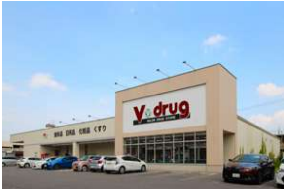
敷地面積 / 2,591㎡ 出店テナント: Vドラッグ