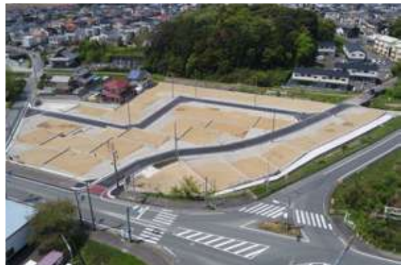
ブリックタウン岩井(32区画) 磐田市岩井