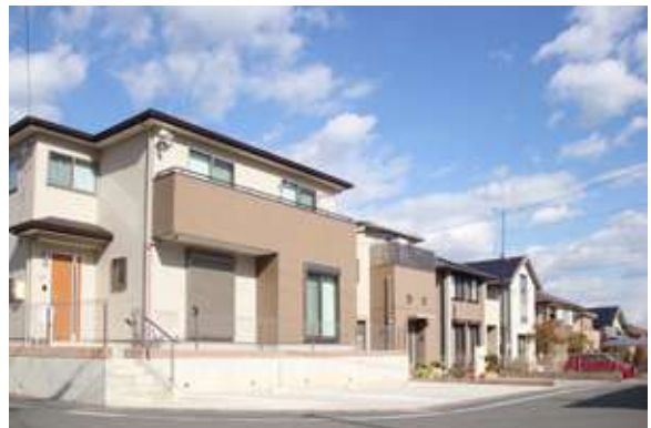
ブリックタウン染地台一丁目(11区画) 浜松市浜北区染地台